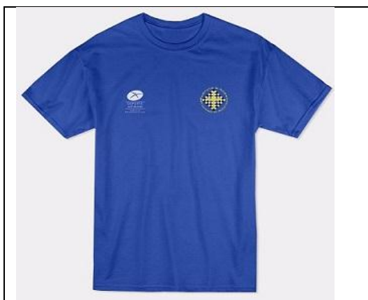
Camiseta oficial de la FAPA. Frontal

Las solicitudes se irán acumulando hasta que pueda hacerse un pedido (mínimo 20 unidades). Por lo tanto, ha de tenerse en cuenta que habrá un tiempo de al menos 2 semanas entre la solicitud y la posibilidad de adquirirla.