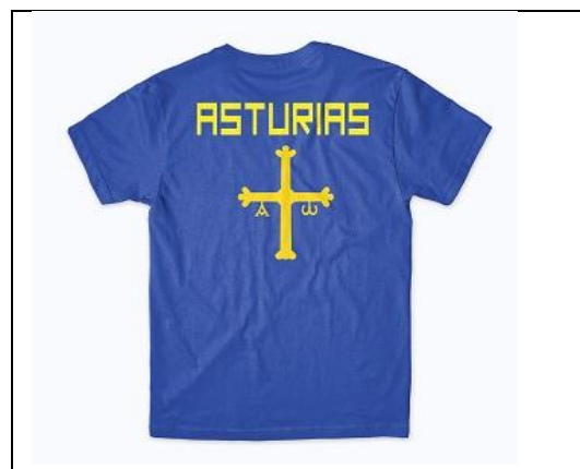
Camiseta oficial de la FAPA. Trasera