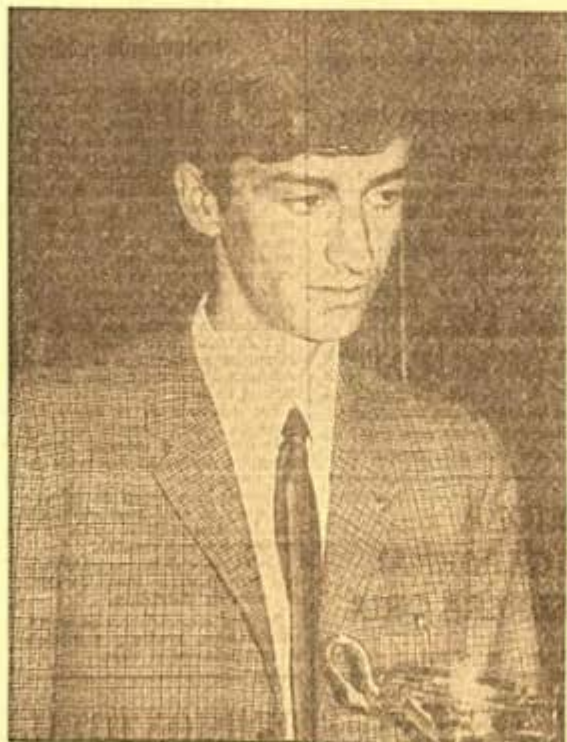
EL CAMPEON DEL TORNEO