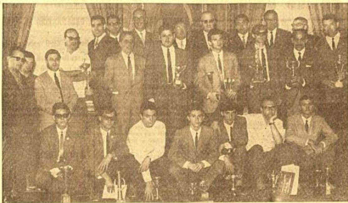
LOS PARTICIPANTES JUVENILES POSAN CON LAS AUTORIDADES LOCALES Y FEDERATIVAS

Finalmente intervino el alcalde, con la elocuencia propia en él, hizo historia de lo tradicional que es el ajedrez en Gijón, recordó como en otras épocas pasaron por esta ciudad grandes maestros como Alakine, Euwe, etc., que tanta preciosidad y gloria dejaron escritas en el historial deportivo de esta villa. Seguidamente, ofreció a los federativos toda clase de facilidades para que sean organizadas nuevas competiciones en el futuro. Felicitó a los participantes por la dedicación que demostraron a lo