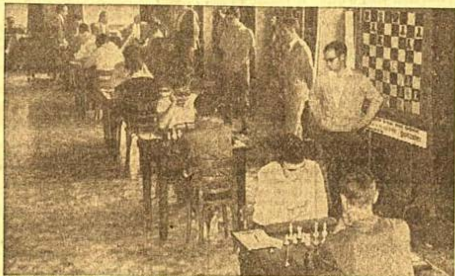
Una vista de los salones del Centro Asturiano durante el desarrollo de las competiciones